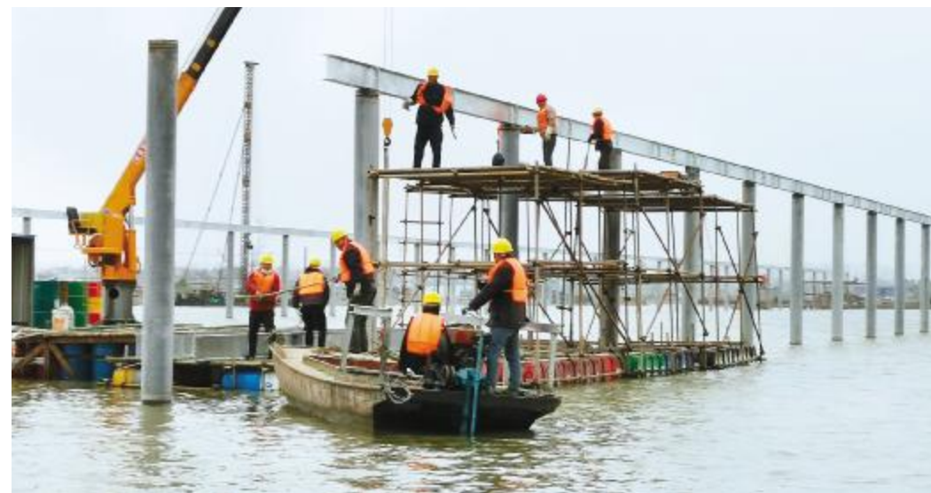
项目建设,高效推进