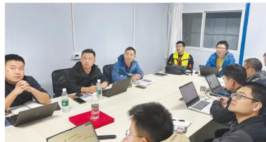
天门二期项目团队召开物资盘点专题会议