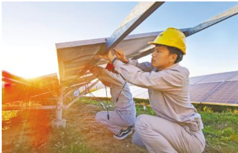
专注的运维人,更换光伏组件