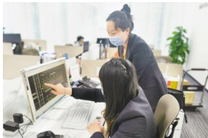
协同配合,高效推进