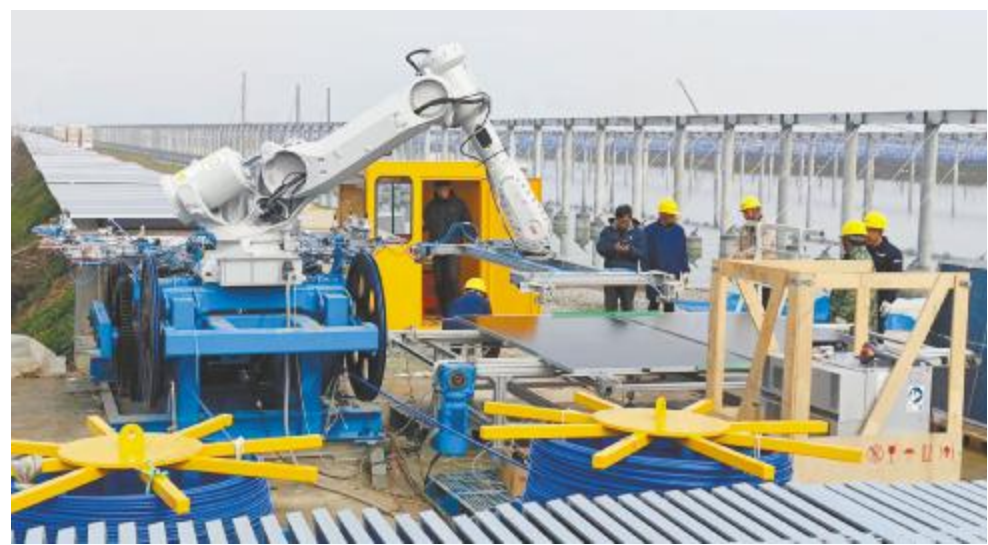
组件自动化安装设备野外测试

或许只有真正理清通威“渔光一体”的商业逻辑,明晰独有优势,才能在项目开发中更有底气,推动更多项目落地生根,开花结果。