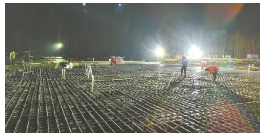
夜以继日,抢抓施工