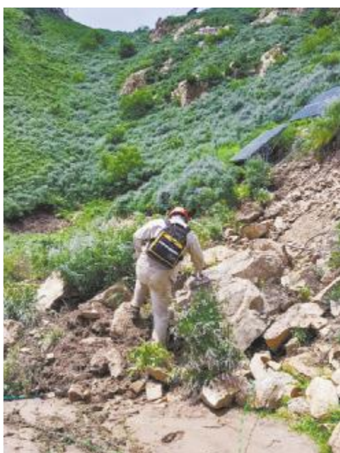
翻山越岭,排查隐患