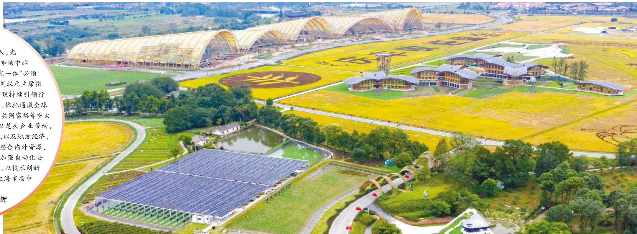
通威渔光示范范围

随着我国双碳战略的深入推进,央企、国企的大举介入,光伏终端市场竞争日趋激烈。如何在市场中站得住、稳得住、发展好成为新时期“渔光一体”必须面对的问题。2022年,通威新能源按照刘汉元主席指示,深挖商业和技术两项重点工作,并实现持续引领行业,铸强“渔光一体”优势。商业模式方面,依托通威全球首创“渔光一体”模式,结合国家乡村振兴、共同富裕等重大战略部署,探索“产业园+产业链”模式,以龙头企业带动,推进三产融合,实现农村生产力的再提升,以及地方经济、企业发展、农民增收的多赢。技术方面,整合内外资源,深耕柔性支架,迭代升级柔性3.0,持续加强自动化安装设备及新材料的研发,推动降本增效,以技术创新铸强“渔光一体”核心竞争优势,在红海市场中勇立潮头。