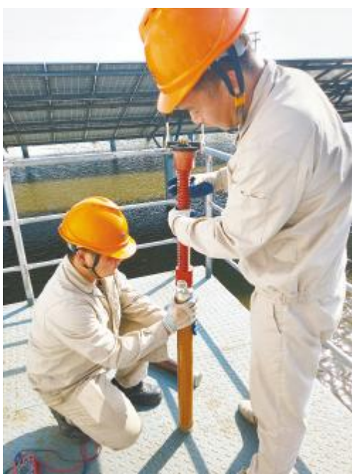
齐心协力,维修设备