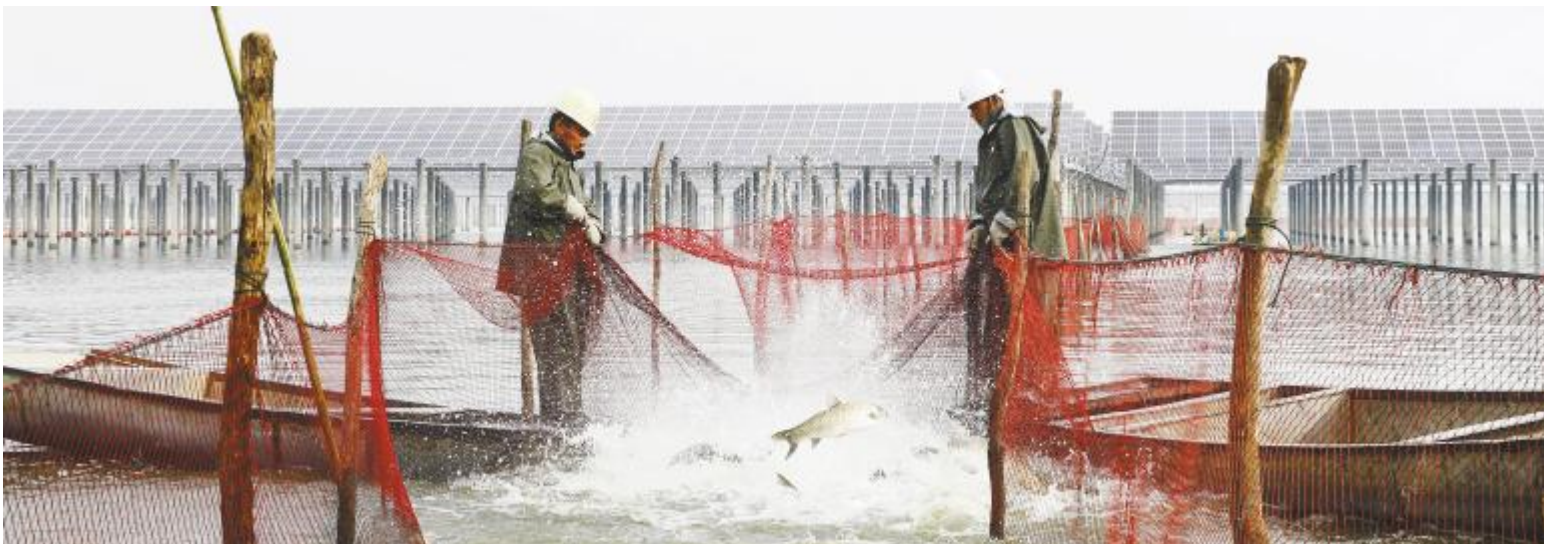
通威泗洪“渔光一体”基地渔业丰收

传承通威创新基因,通威新能源研发团队在人才、资源有限的情况下,不断开拓创新,为“渔光一体”铸强核心竞争力,持续引领行业发展注入了技术动能,为新时期“渔光”新发展提供了有力支撑。