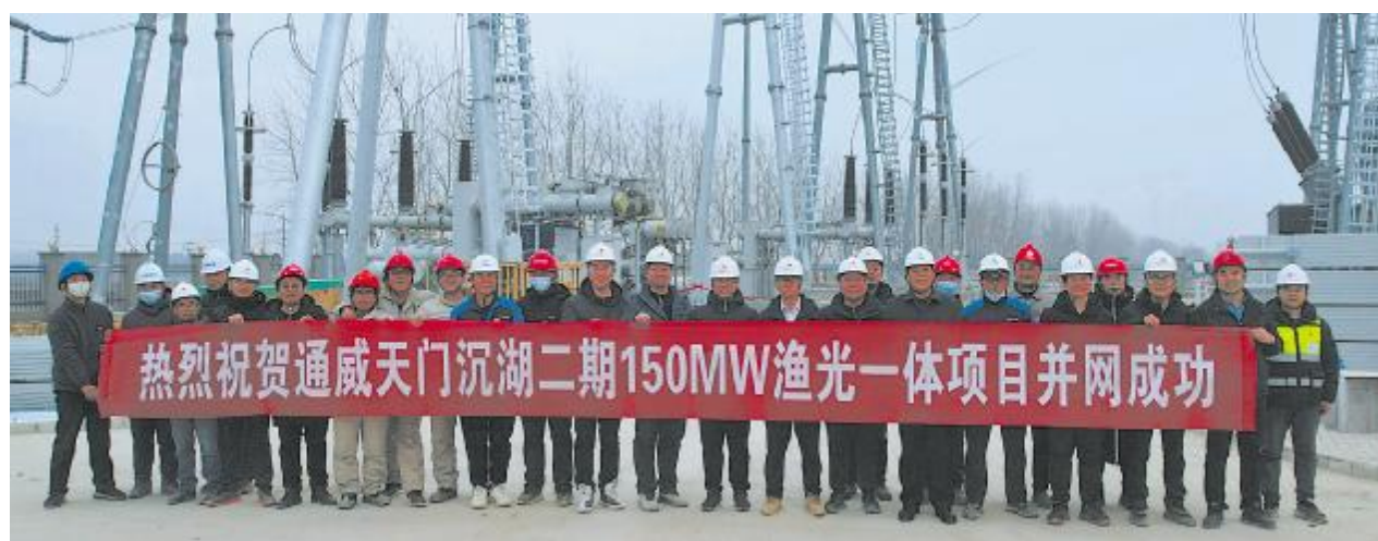
通威天门“渔光一体”二期项目实现阶段性并网